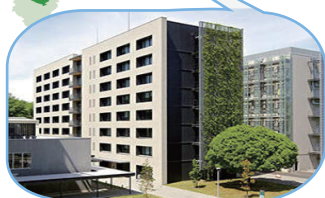
名古屋大学 宇宙地球環境研究所