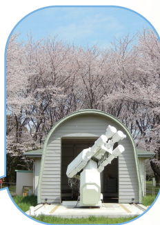
国立天文台 三鷹キャンパス