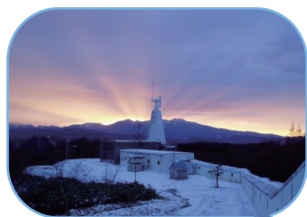
京都大学 飛騨天文台